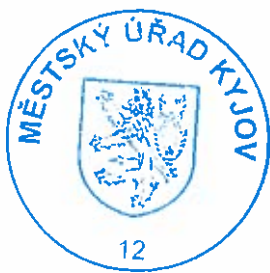
Ing. Jindřich Baturý pověřený vedením stavebního úřadu

Společné povolení má podle § 94p odst. 5 stavebního zákona platnost 2 roky. Stavba nesmí být zahájena, dokud rozhodnutí nenabude právní moci.